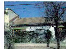
Calle los Capitanes