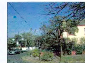
Calle Álvarez Condarco