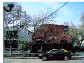
Calle Álvarez Condarco