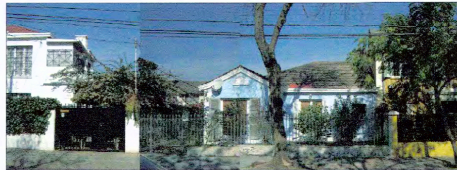
Calle Juan Agustín Barriga