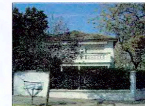
Calle José Tomás Reider