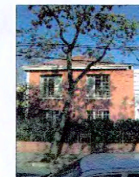
Calle Juan Agustín Barriga