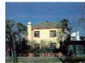
Calle Álvarez Condarco