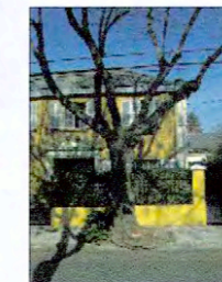
Calle Juan Agustín Barriga