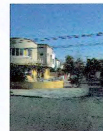
Calle José Tomás Reider