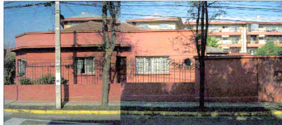
Calle Emilio Del Porte