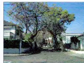
Calle José Tomás Reider