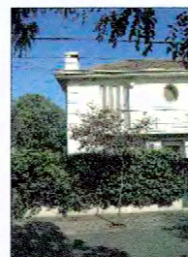
Calle los Capitanes