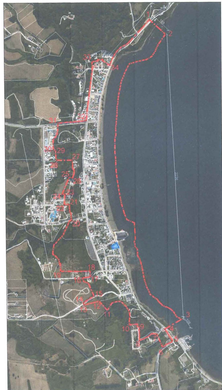
PLANO DE UBICACIÓN ESCALA GRÁFICA