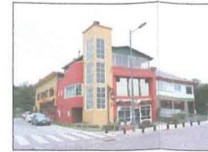
Edificio de Bomberos