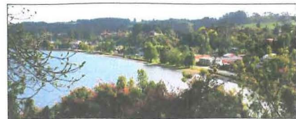
Vista de la costanera y espalda verde desde extremo norte de Frutillar Bajo.