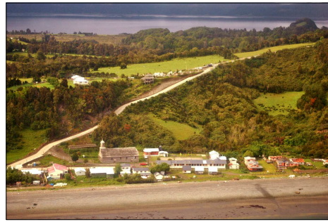
Vista de la iglesia y su entorno desde el mar