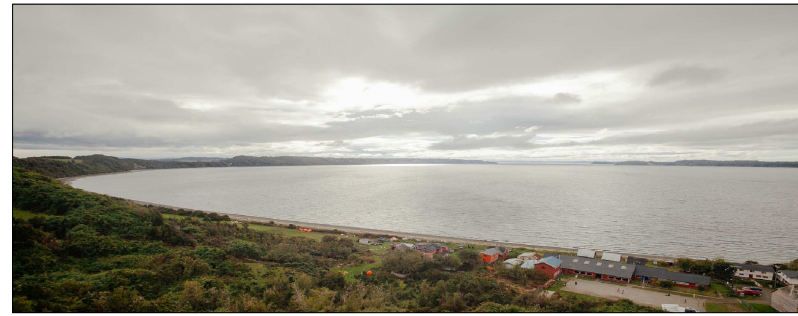
Vista del poblado desde la altura