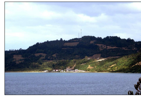
Paisaje del entorno