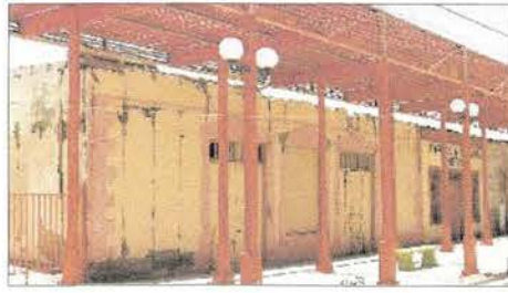
Vista principal del Teatro de Huara