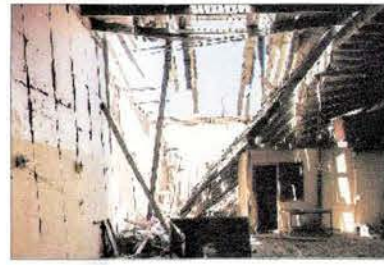
Vista interior del Teatro de Huara