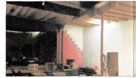
Vista interior del Teatro de Huara