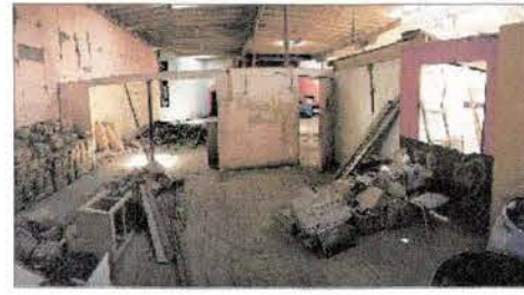
Vista interior del Teatro de Huara