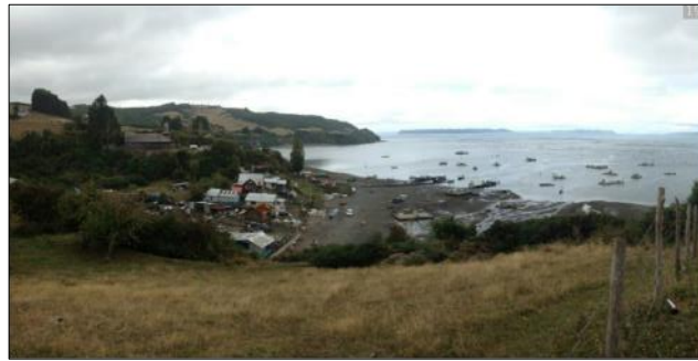
Vista panorámica poblado de Quetalco