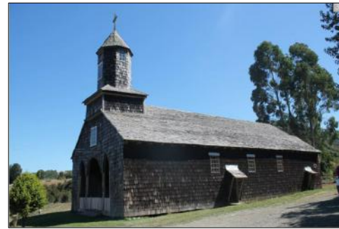
Fachada nororiente de la iglesia