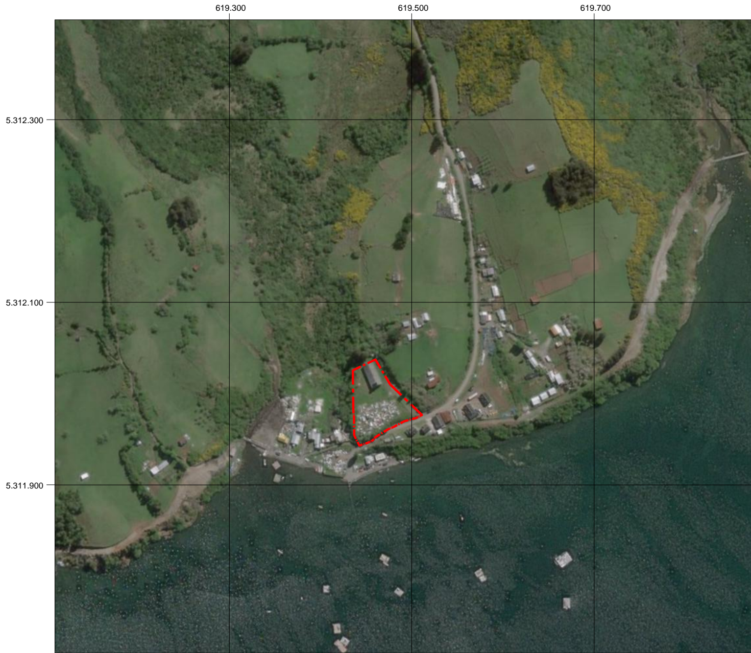
PLANO DE UBICACIÓN ESCALA GRÁFICA