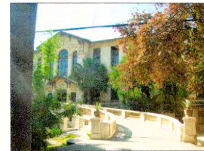
Acceso Pabellón Valentín Errázuriz