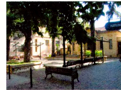
Vista plazoleta interior