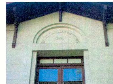
Inscripción: "Pabellón de Infecciosos"

NOTA: Plano elaborado en el Consejo de Monumentos Nacionales en base a: • Planos facilitados por el Ministerio de Obras Públicas • Fotografías tomadas por Macarena Silva del CMN • Las cotas prevalecen ante el dibujo y están expresadas en metros. * Esta información no acredita propiedad