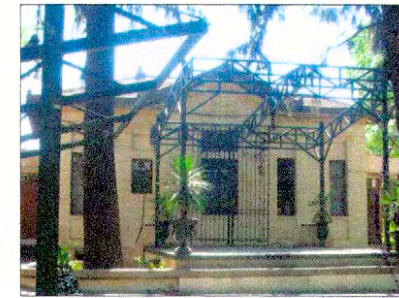
Pabellón Juana de Jesús