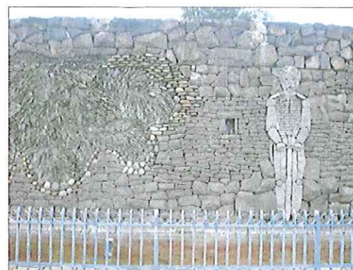
Vista detalle de mural