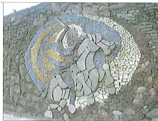
Vista detalle de mural