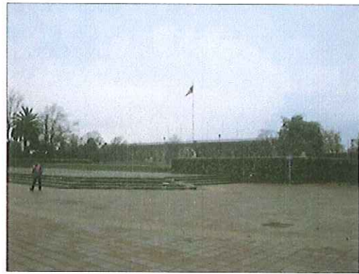
Vista panorámica del Mural desde Av. General Bernardo O'Higgins