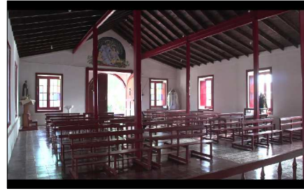
Vista interior de Iglesia San Miguel de Azapa