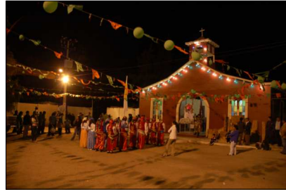
Vista a Iglesia San Miguel de Azapa