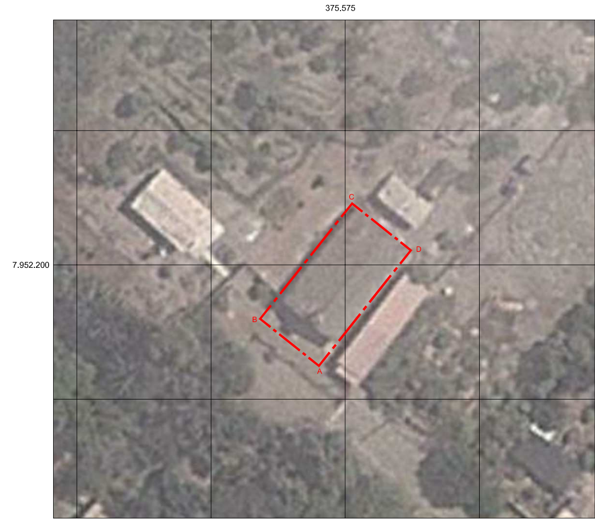
PLANO DE UBICACIÓN ESCALA GRÁFICA 0 10 20 30 m