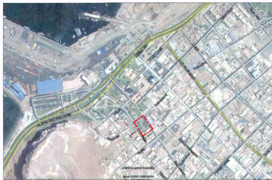
Fotografía aérea obtenida de Google Earth