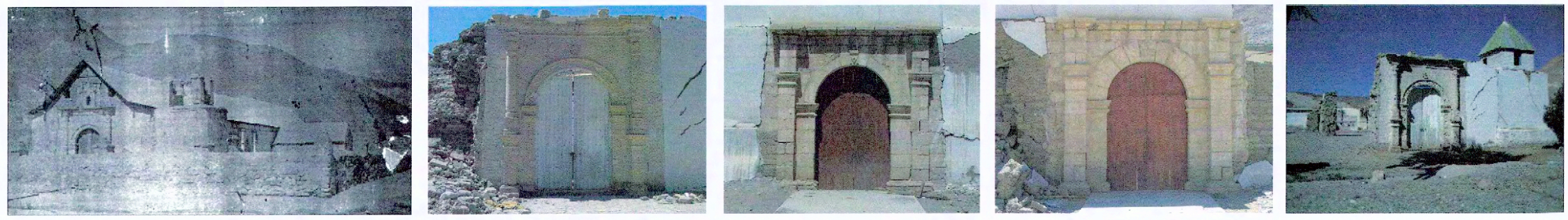
Imagen de la antigua Iglesia

PLANO DE LÍMITE Escala gráfica 0 3 6 9 12 m