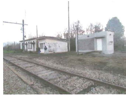
Vista de la Estación de Perquillauquén