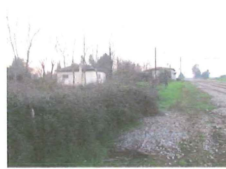
Vista de la Estación desde el sur