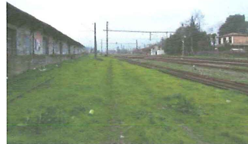
Vista panorámica de la estación de Chimbarongo.