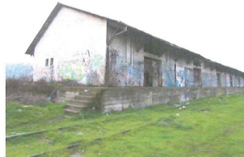
Vista de la bodega desde el sur.