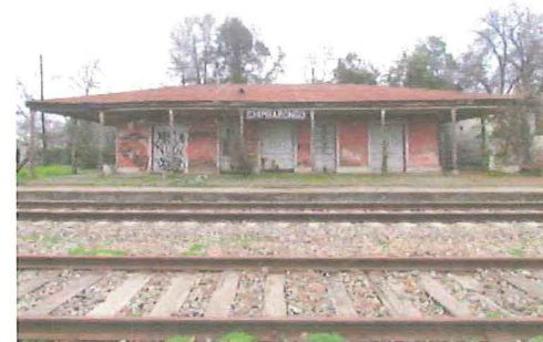
Estación de Chimbarongo.