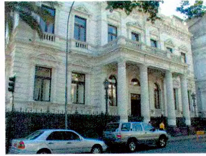
Vista fachada principal por calle Catedral