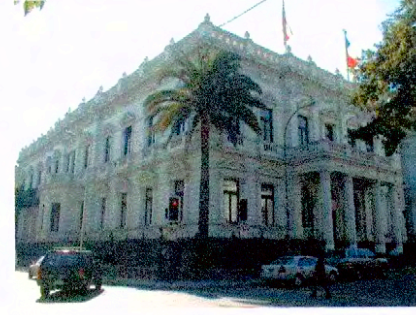
Vista fachada principal y lateral por calle Morandé