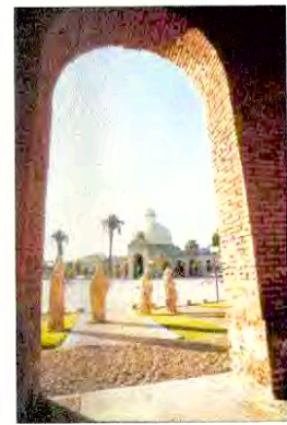
Vista Plaza La Paz desde portales