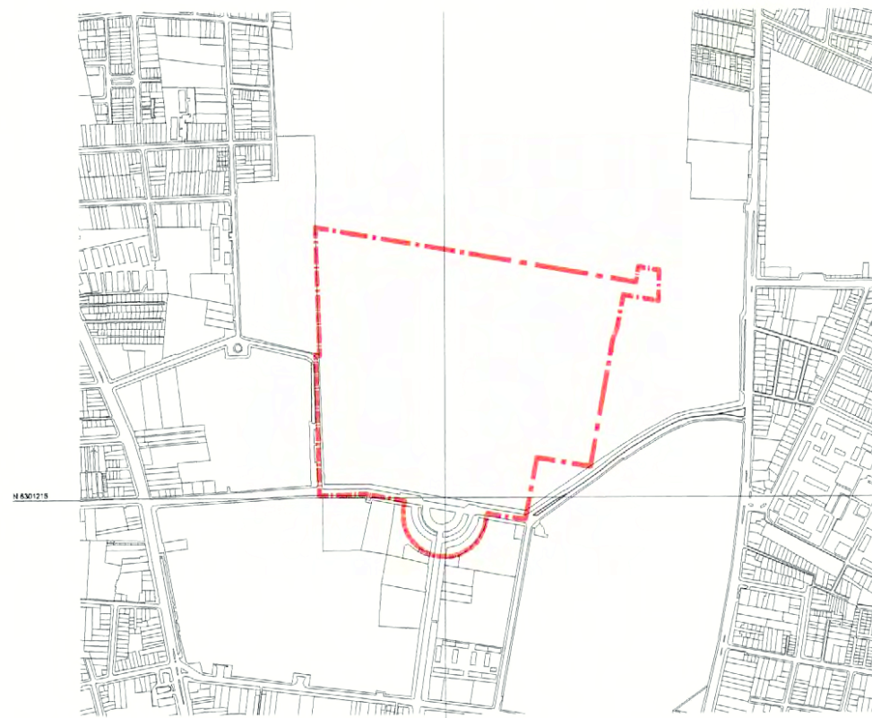
PLANO DE EMPLAZAMIENTO ESCALA GRÁFICA