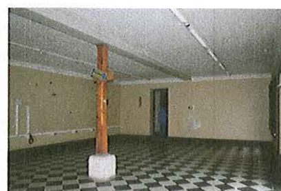
Vista interior de casa Hodgkinson