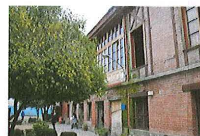
Vista oriente de casa Hodgkinson

NOTAS: Plano elaborado en el Consejo de Monumentos Nacionales en base a: • Base catastral I. Municipalidad de Graneros • Levantamiento GPS Datum WGS 84, Huso 19 S, 2012. • Las cotas prevalecen por sobre el dibujo, son aproximadas y están expresadas en metros. En caso de fondos de predio, estos prevalecen por sobre la cola. • Esquicio de Chile: "Autoriza su circulación, por Resolución N°475 del 22 de octubre de 2014 de la Dirección Nacional de Fronteras y Límites del Estado".