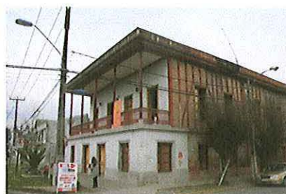
Vista principal de casa Hodgkinson