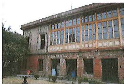
Vista oriente de casa Hodgkinson