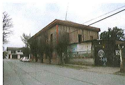
Vista lateral de casa Hodgkinson