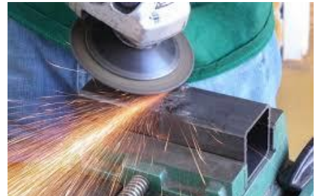
Fig. 1 Esmerilado de una pieza metálica.