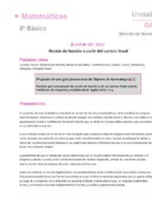
Guion de uso del software