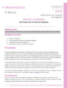
Guía para el estudiante

La actividad Producto de binomios hace uso de los siguientes recursos de aprendizaje: