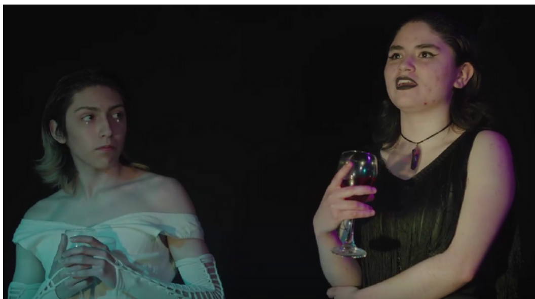
Estudiantes durante el montaje de "Bodas de sangre" Liceo Artístico Guillermo Gronemeyer - Quilpué