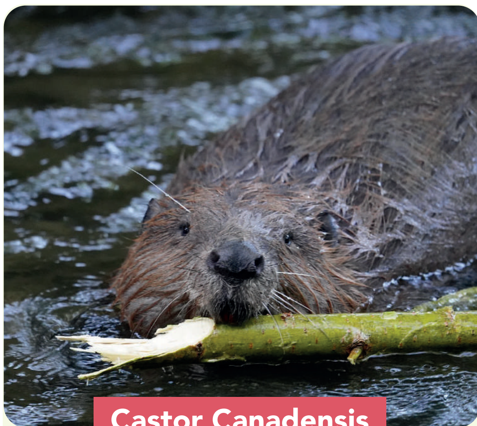
Castor Canadensis Roedor Semiacuático